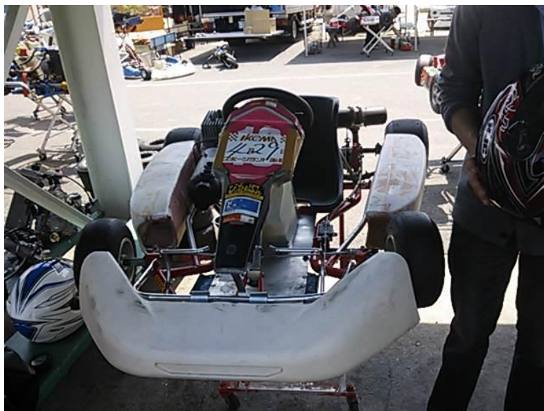
図9 スポーツランド生駒様にて使用させて頂くカート

今年度から、スポーツランド生駒様にカート走行における走行費をサポートして頂き、また、カートのエンジン、シャシの整備を手配して頂けることになりました。ありがとうございます。ドライバーの練習は重要ですので、有効に活用させていただきます。今後とも宜しくお願い致します。