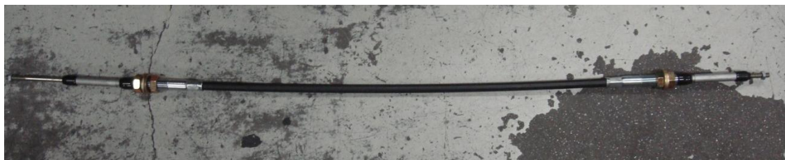
図5 株式会社丸三自動車商会様に製作して頂いたプッシュプルワイヤー

4月初旬、株式会社丸三自動車商会様にプッシュプルワイヤーをスポンサー価格で提供して頂きました。迅速な対応、誠にありがとうございました。今後とも宜しくお願い致します。