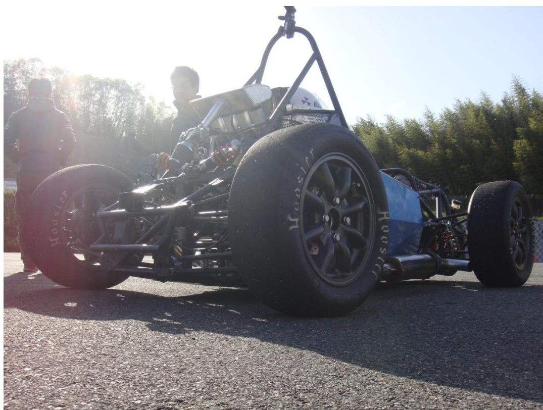
図 1 シェイクダウン時の様子

4 月は車両製作も最終段階を迎え、シェイクダウンに向けての活動が中心となり、結果として、4 月 21 日にシェイクダウンを完了致しました。そして、今後の本格的な試験走行に向けて計画を立て、走行を重ねると共に、静的審査対策も進めて参りました。多大なるご支援をして頂いております企業の皆様、先生方、OB の皆様方に深く感謝いたします。今後とも宜しくお願い申し上げます。