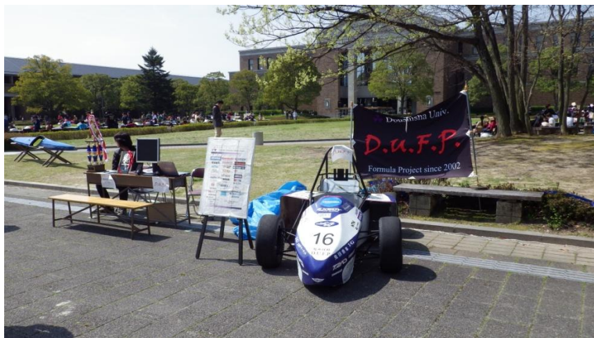
図2 新入生勧誘期間の私たちのブース

4月1日(月)、本学の入学式が開催されました。翌日からの2～5日には新入生のサークル勧誘のオリエンテーションが開催されました。私たちのブースでは、解体途中ではありましたが昨年度の車両の展示も行い、新入生に十分なアピールができました