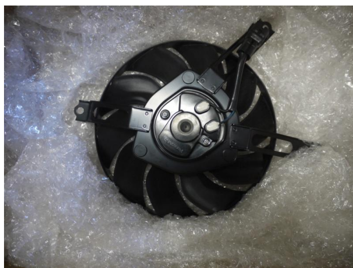
図8 株式会社ティラド様にご支援して頂いたラジエータファン

4月下旬、株式会社ティラド様にラジエータファンを提供して頂きました。前回ラジエータのご支援を頂きましたが、それに引き続きのご支援となりました。ありがとうございます。今後とも宜しくお願い致します。