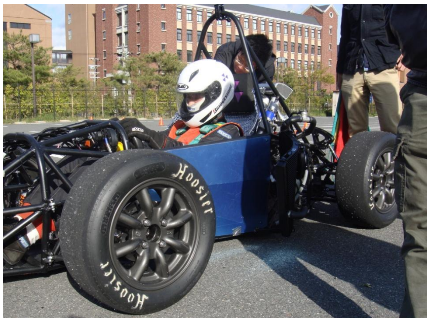
図4 シェイクダウン時の様子

4月21日(日)、製作した今年度の車両を走行させ、無事にブレーキテストも合格し、シェイクダウン致しました。ここで一つの区切りを迎えることが出来ましたが、これから走行を重ね、車両を熟成させていきます。皆様、今後とも宜しくお願い致します。