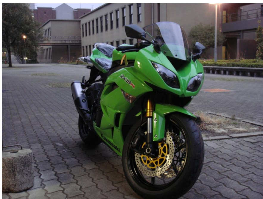
図6 川崎重工業株式会社様にご支援して頂いたバイク

4月下旬、川崎重工業株式会社様よりバイク1台分のご支援を頂きました。来年度からの車両の動力の中心となるエンジンにこのバイクのものを使用する予定です。これから、調整等も進めていきたいと思っております。この度はありがとうございました。今後とも宜しくお願い致します。